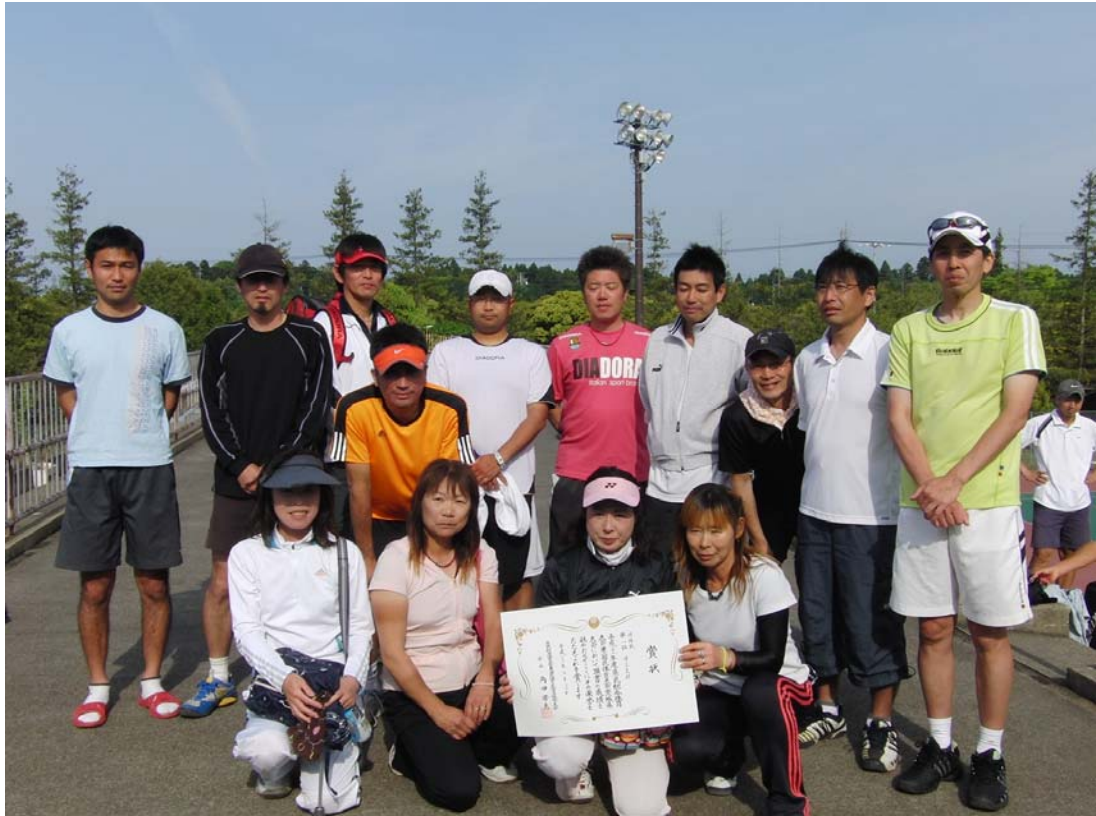
県民総体 優勝 日立支部