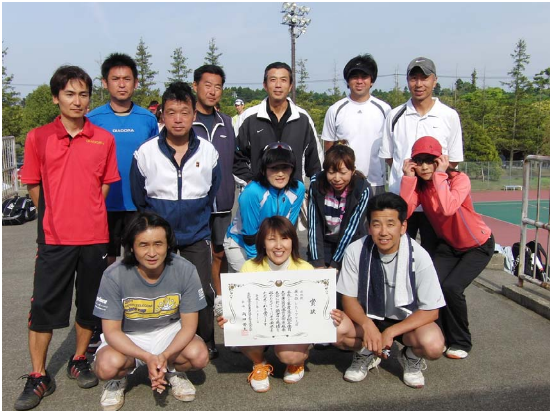
県民総体 準優勝 ひたちなか支部